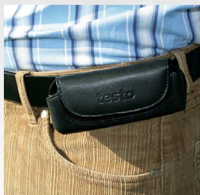
Удобный чехол для ремня (для testo 810, 610, 606, 410, 510, 511, 460 и 540).