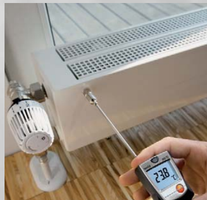
Измерения поверхностной температуры радиатора