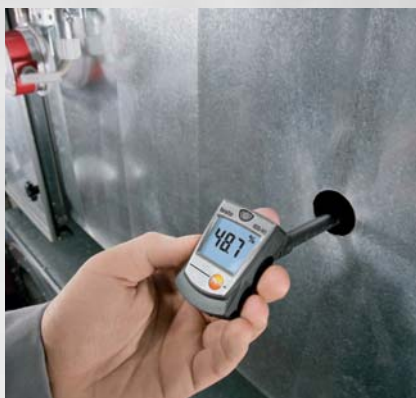
Мониторинг влажности воздуха в воздуховоде