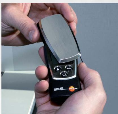
Защитная крышка предотвращает повреждения прибора (для testo 810, 610, 606, 410, 510, 511, 460 и 540).