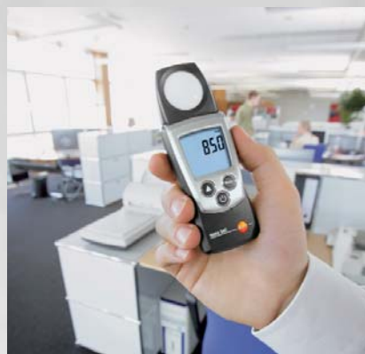
Измерение интенсивности освещенности на рабочих местах