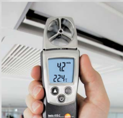
Измерения скорости потока воздуха на вентиляционных выходах с помощью 40 мм крыльчатки