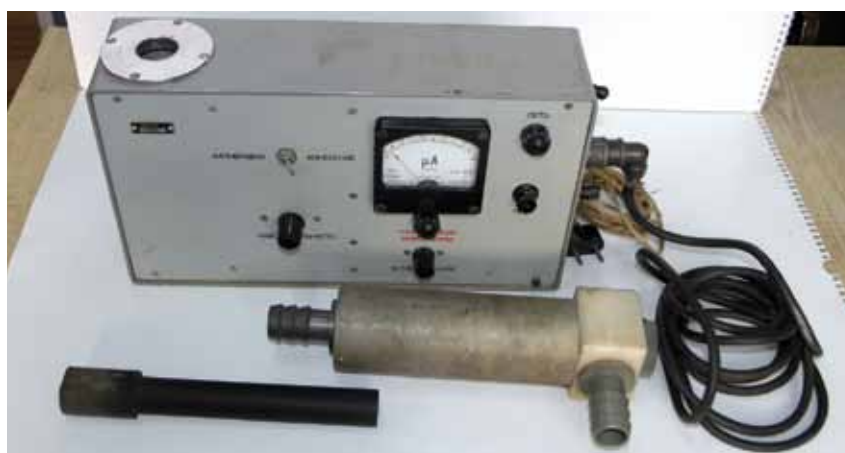
Рис. 1 Анализатор концентрации суспензии АКС-1 с

Анализатор АКС-1 с включают в сеть и после прогрева в течение 15 мин ручкой “установка нуля” выводят стрелку микроамперметра на нулевую отметку. После тщательного взбалтывания в отверстие встроенного датчика анализатора вставляется пробирка с образцовой суспензией, имеющей концентрацию 30 г/л. Через 30 с для масляной суспензии (или 7...10 с для водной) ручкой “чувствительность” плавно выводят стрелку микроамперметра анализатора на отметку 30 мкА. После тщательного перемешивания (взбалтывания) пробирки с образцовыми суспензиями в концентрациях 40, 30,